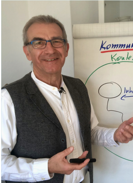
Gruß aus dem Online-Seminarraum