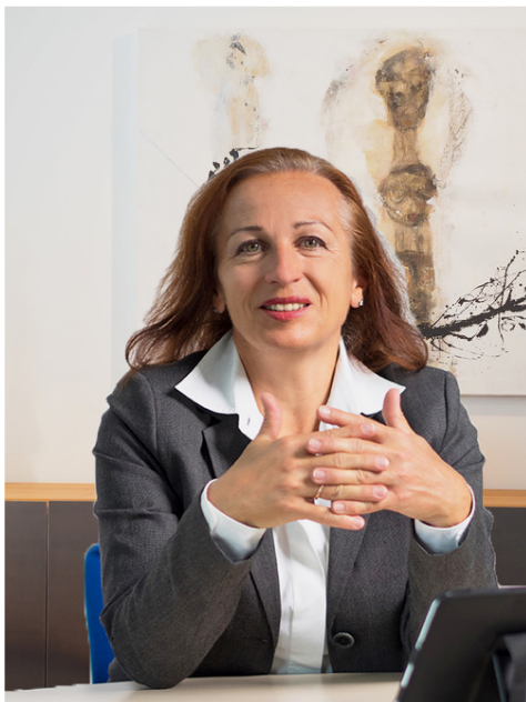
Gruß aus dem homeoffice